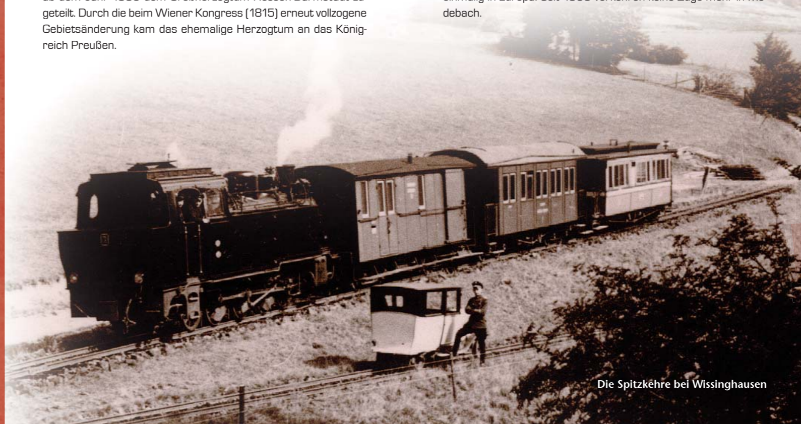
Die Spitzkehre bei Wissinghausen

Die Gründerzeit (1870–1879) brachte keine wesentliche Verbesserung der wirtschaftlichen Verhältnisse, Medebach war eine reine Ackerbürgerstadt. Erst um die Jahrhundertwende waren Anzeichen für eine allmähliche Aufwärtsentwicklung festzustellen. Neben dem für die Entwicklung der Wirtschaft notwendigen Ausbau der Verkehrsstraßen bekamen 1903 die Grafschaftsgemeinden und Medebach einen Kleinbahnanschluss. Diese Schmalspurbahn Steinhelle-Medebach war verkehrstechnisch ein Kuriosum. Auf einer Strecke von 1,4 km musste sie einen Höhenunterschied von 79,60 m überwinden, den sie durch eine so genannte Spitzkehre erreichte. Diese Schienenzuführung war einmalig in Europa. Seit 1953 verkehren keine Züge mehr in Medebach.