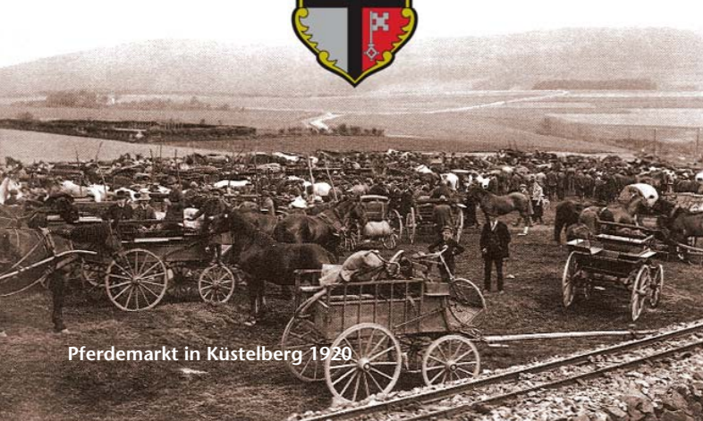
Pferdemarkt in Küstelberg 1920