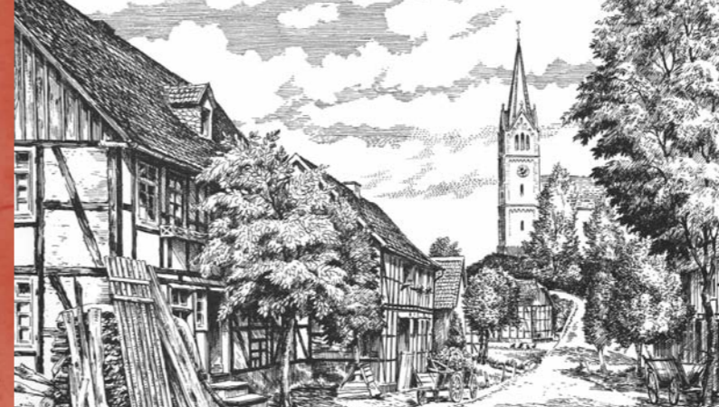
Haus Padberg / Ewers